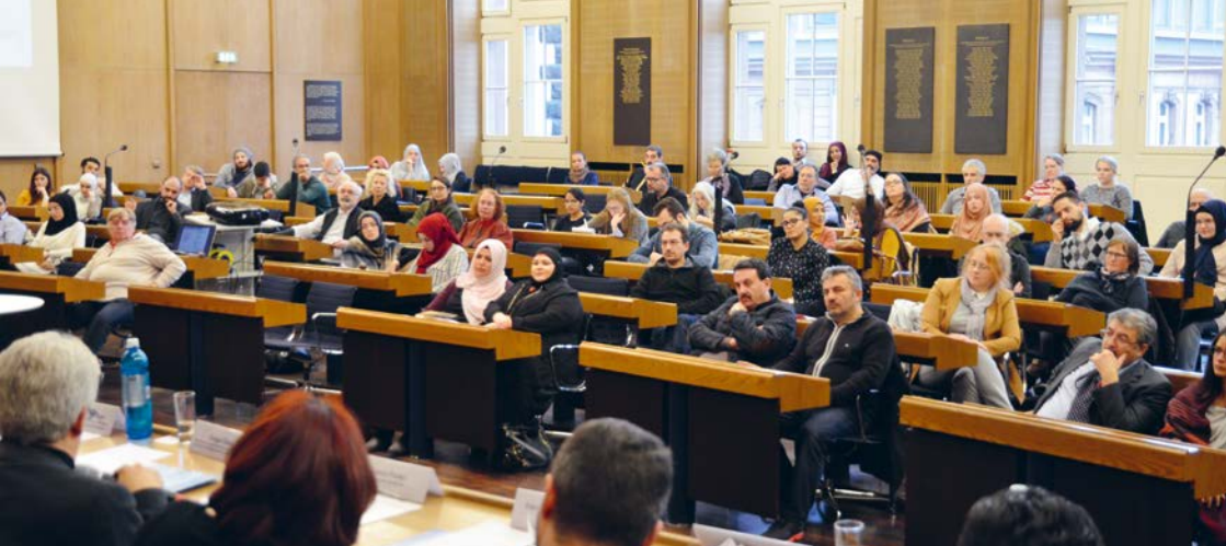
Treffen des Landesausländerbeirats.