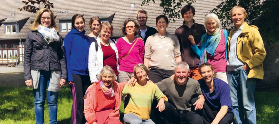
Erd-Charta-Botschafter*innen beim Ausbildungsworkshops.