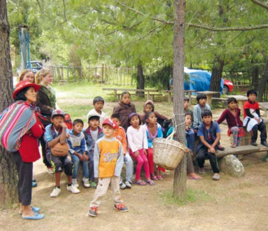
Gemeinsam ausruhen nach getaner Arbeit.