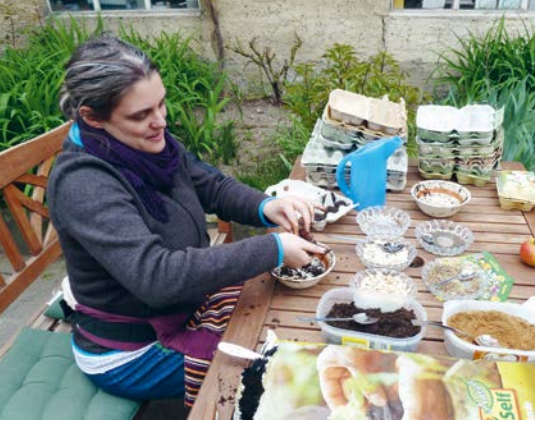
Terra Viva-Mitglieder stellen Saatbomben her, um Bienen und Schmetterlinge anzulocken.