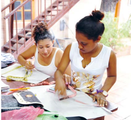
Im Frauenzentrum »Claudia Chamorro« – Ausbildung zur Schneiderin.

Ein Graben für eine Wasserleitung entsteht.