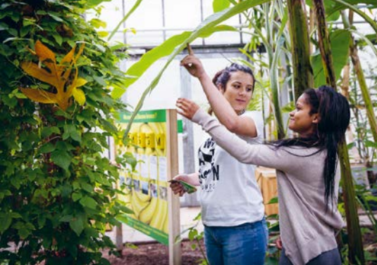
Außerschulischer Lernort Tropengewächshaus.