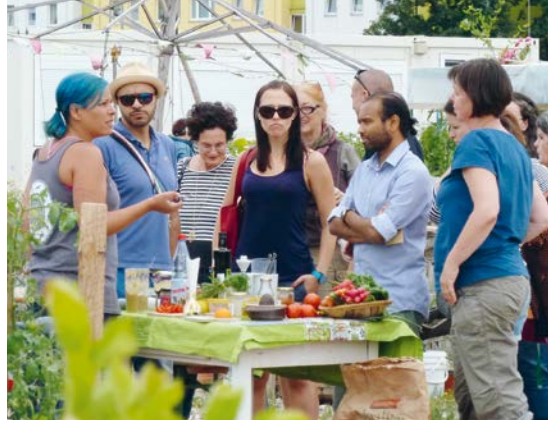
Interessierte beim Sommerfest 2015 am Terra-Viva-Stand.

Als im Jahr 2013 der einzige Bioladen im Offenbacher Nordend schloss, ging es den Menschen dort wie vielen anderen in Hessen: Sie konnten sich nicht ohne größeren Aufwand mit ökologisch erzeugten Lebensmitteln versorgen. Daher schlossen sich einige ehemalige Kund*innen zusammen und merkten schnell: »Unsere Ziele und Motivationen sind doch vielfältiger und breiter als wir dachten. Gemeinsam wollen wir mehr erreichen, als »nur« Bio-Produkte zu kaufen. Wir wollen auch etwas gegen Lebensmittelverschwendung tun, den massiven Verpackungsmüll reduzieren, weniger oder gar keine tierischen Produkte konsumieren, lange Transportwege vermeiden und allgemein energie- und ressourcensparend konsumieren.« Um all diese Ziele umsetzen zu können,